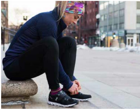
Course à pied